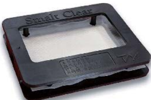
エアコン取付ケース 550円(税込)