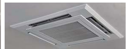
見えないところに取り付けるので 除菌中も室内の雰囲気損ないません